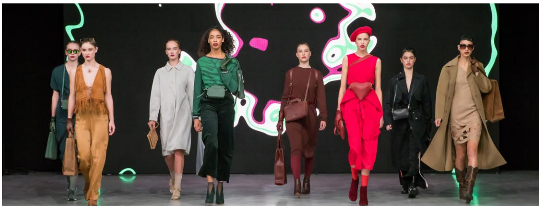
Foto: award winning MYOMY show; sustainable fashion week October 2018

De 7,25% MYOMY DO GOODS Obligaties (de " Obligaties ") worden aangeboden door Goodforall BV . De aanbieder is ook de uitgevende instelling van de Obligaties.